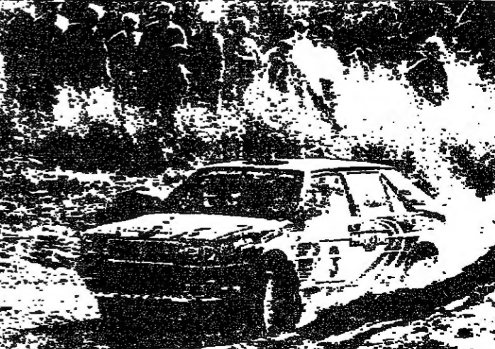
الالميركي ماسيو بياسون على سيارته لانسيا فلانكا ١٦ ف احدث المركز الاول (روبيرت)

فاز المتسابق الالميركي ماسيو بياسون على سيارته لانسيا فلانكا بسباق المرحلة الأولى من رابي الارجنتيين الدولي بعدما قطع المسافة بزمن قدره ٥٦ دقيقة و٣٠ ثوان واحدة عن بياسون... وفي المرحلة الثالثة جاء المتسابق الفنلندي يوها كوتكونين على سيارته لانسيا فلانكا بفارق ثلثين... واحتل الارجنتيني ارنستو سوتو على سيارته لانسيا المرحلة الرابعة بفارق ٥ دقائق و٣٧ ثانية... واحتل غوستافو تيريز من الالورغواي على سيارته لانسيا المرحلة الخامسة بفارق ٥ دقائق و٥٥ ثانية.